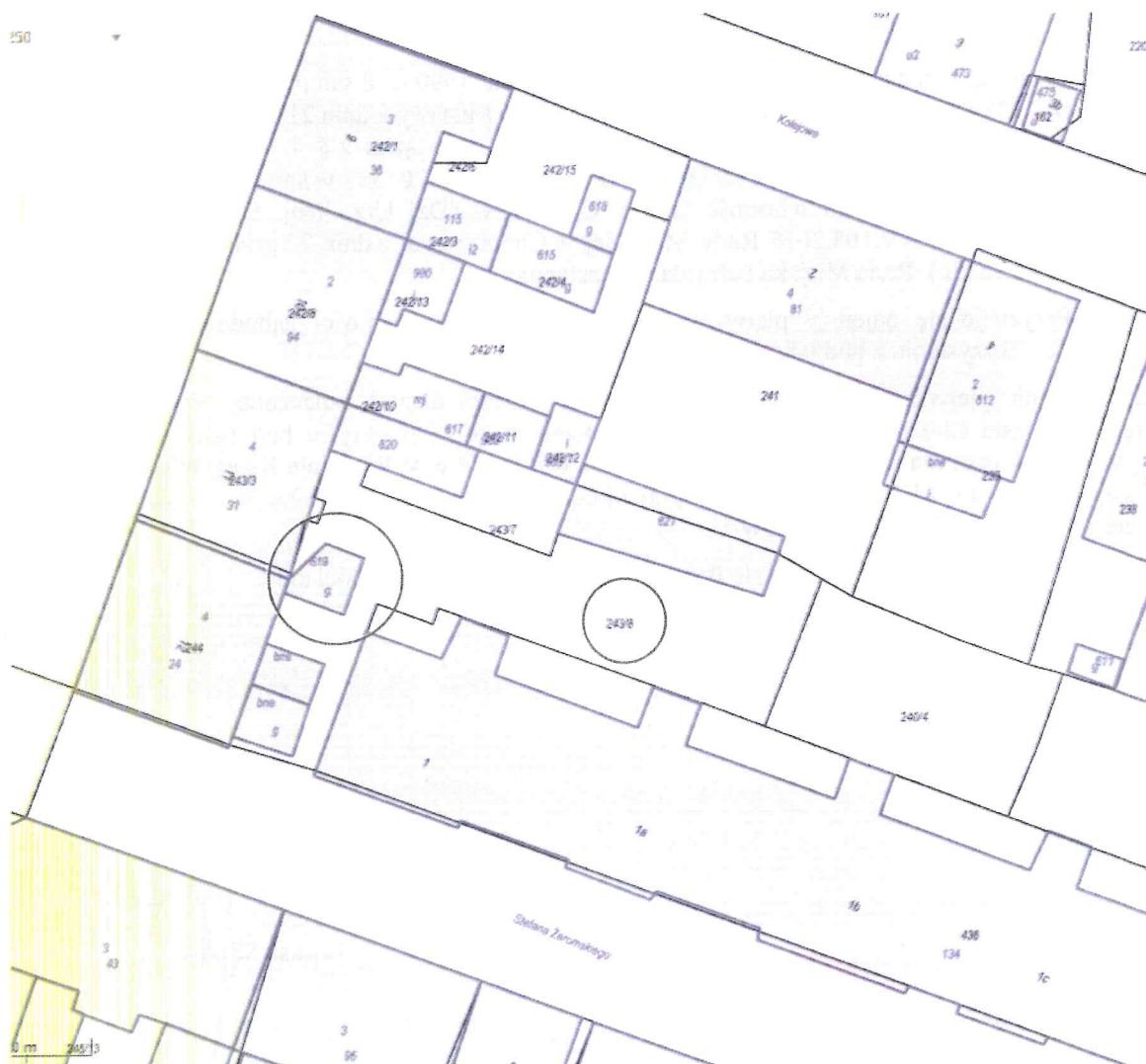
Budynek nr 619 na działce nr 243/8 obr. 2 miasta Chocianów