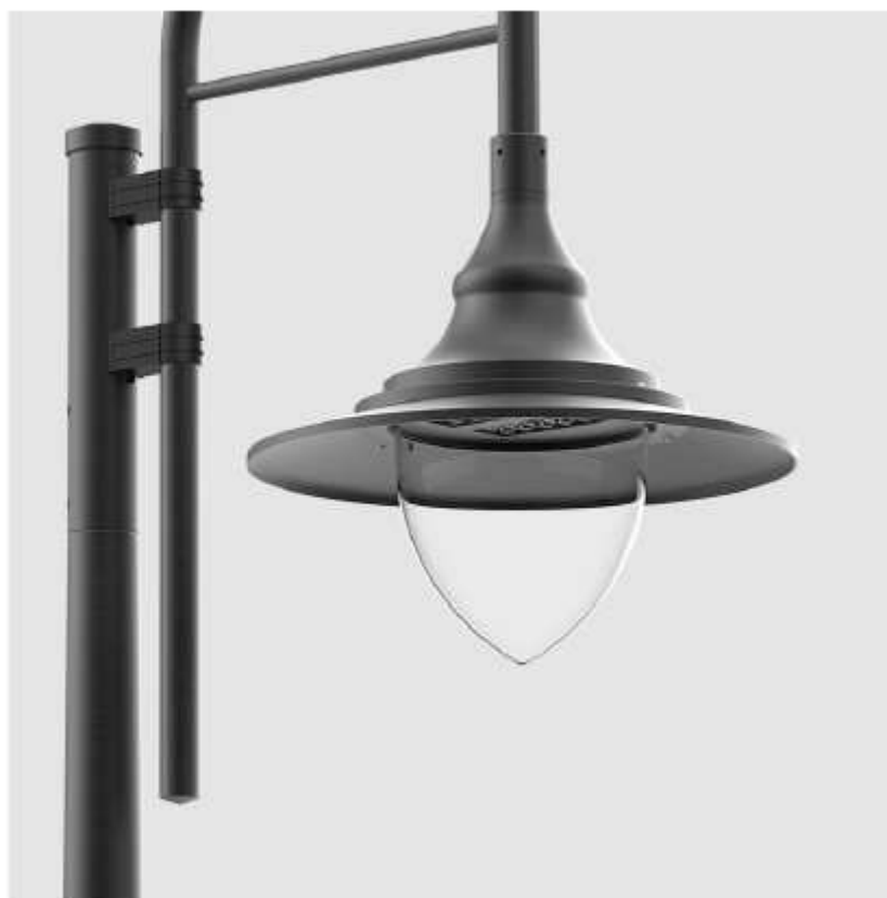
Rys nr E 05 – Oprawa oświetleniowa