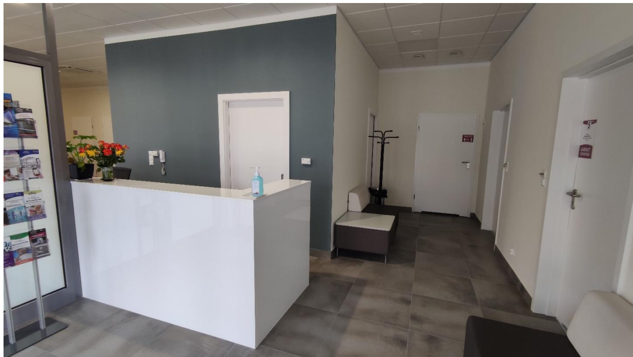
Gabinet lekarski w przychodni zdrowia w Trzebnicach: