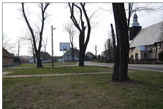
Wymagający modernizacji plac boiska (w oddali sklep oraz świetlica)

Mieszkańcy nie mają odpowiednio przystosowanych miejsc do spotkań, integracji, aktywności kulturalnej i sportowo-rekreacyjnej. We wsi znajduje się Świetlica Wiejska czynna dwa razy w tygodniu, w środy i w niedziele, gdzie do dyspozycji dzieci i młodzieży są piłkarzyki oraz stół do ping-ponga. Ponadto w świetlicy odbywają się zebrania wiejskie, zebrania okolicznościowe oraz jest możliwość wynajmu na imprezy rodzinne. Jednak problemem i