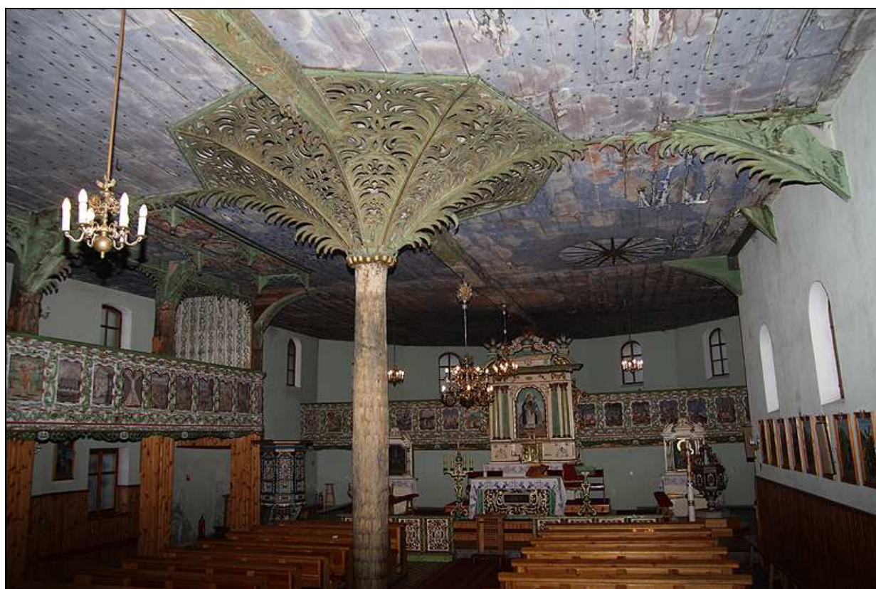
Wnętrze kościoła pw. św. Jacka - prezbiterium jak i całe wnętrze jest bogato zdobione polichromią