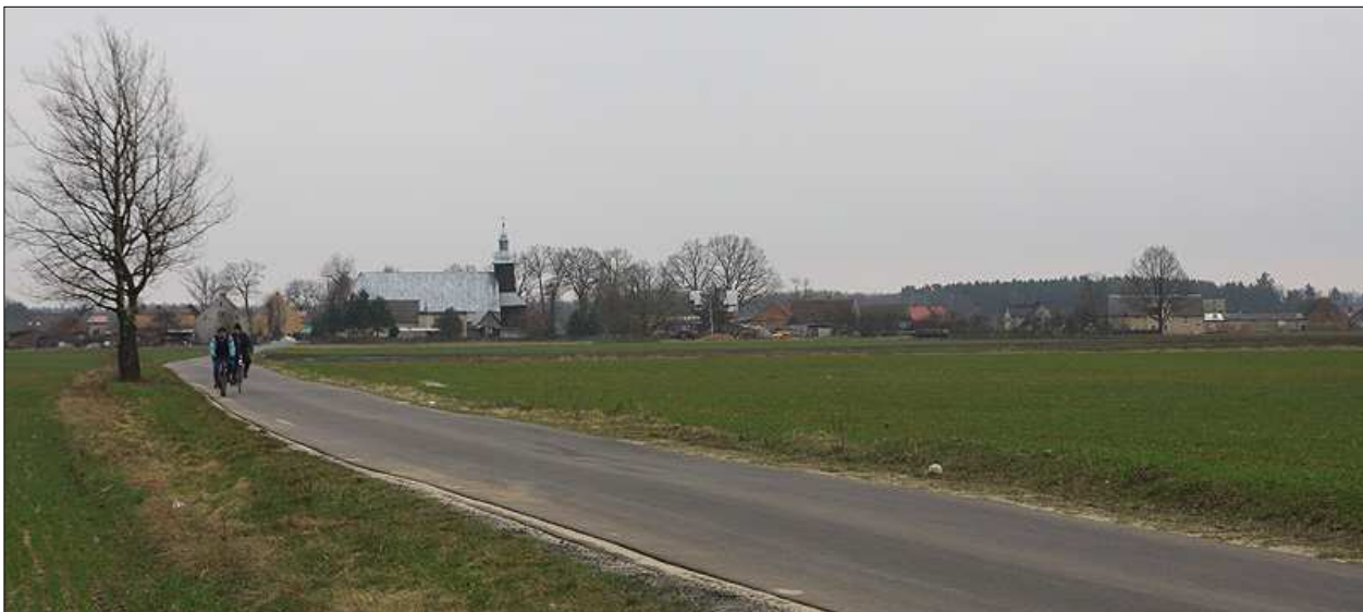
Kościół św. Jacka w Pogorzeliskach wkomponowany w zabudowania wsi

Zarówno wieś jak i gmina współpracują z innymi samorządami, organizacjami pozarządowymi i przedsiębiorcami z regionu w ramach Lokalnej Grupy Działania „Wrzosowa Kraina” (obejmującej obszar 6 gmin tj., Bolesławiec, Chocianów, Chojnów, Gromadka, Lubin, Przemków). Wypracowane już częściowo kierunki rozwoju regionu zapewne zostaną jeszcze bardziej sprecyzowane i pozwolą na dalszą efektywną współpracę gmin, a co najważniejsze miejscowości. Takie podejście zapewni wzmocnienie i bardziej efektywne wykorzystanie możliwości osiągnięcia celów zawartych w niniejszym Planie Odnowy Miejscowości.