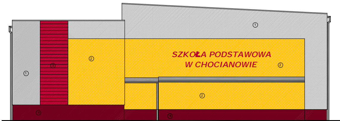
ELEWACJA BOCZNA V-V