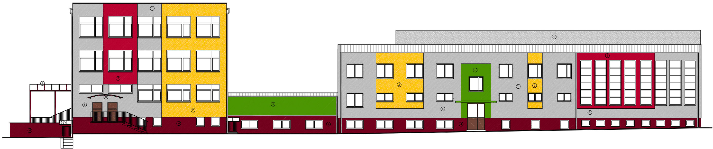
ELEWACJA BOCZNA IV-IV